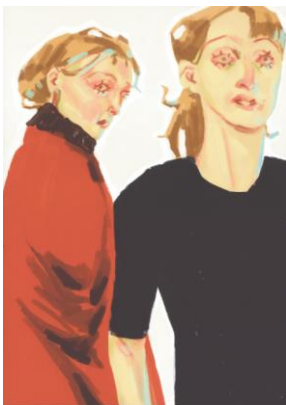
Julia Camenzind, Chance Encounter , 2020 Digitaldruck, Auflage 25 St., 42 x 30 cm, Foto: the artist