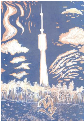
Sigmund Hutter, Ohne Titel , 2020 Holzschnitt, Auflage 25, 42x30cm, Foto: the artist