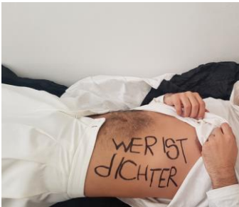
Alexandru Cosarca, WERISTdICHTER? , 2020, Foto und © Alexandru Cosarca